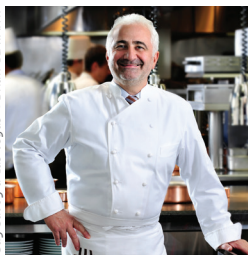
Guy Savoy Chef *** Restaurant Guy Savoy