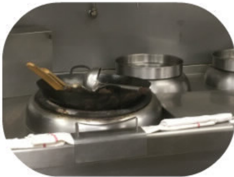
La visite se poursuit avec la découverte des cuisines du Shang Palace, seul restaurant de gastronomie chinoise à avoir décroché une étoile au guide Michelin