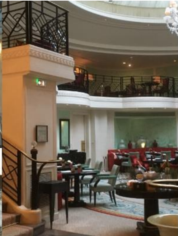
Le restaurant La Bauhinia et son extraordinaire coupole de verre