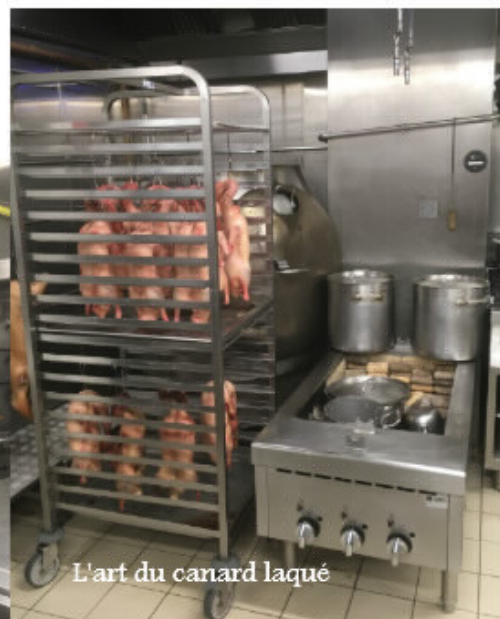
L'art du canard laqué