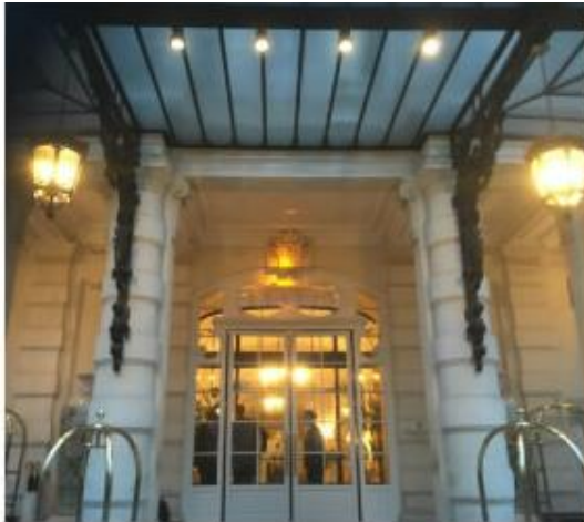
L'entrée du palace